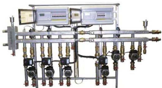
Рис. 1. Гидравлический модуль «ГидроЛОГО!»

На российском рынке представлено несколько производителей модулей обвязки для котельных индивидуальных домов. Так, фирма Meibes (Германия) выпускает параллельные коллекторы, а также присоединяемые к ним гидровывравниватели. Похожую продукцию предлагает и фирма Lovato (Италия). Гидроколлекторы немецкой