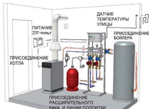
Рис. 4. Гидравлическая обвязка котельной

• После размещения в топочной котла и бойлера ГВС модуль обвязки монтируется так, чтобы упростить его подсоединение к ним. Несущая рама или кронштейны крепятся на стене, либо на полу с помощью шпилек. Это можно сделать на откосе стены и получить дополнительное пространство за рамой, что