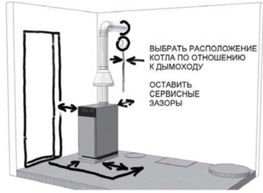
Рис. 2. Размещение теплогенератора